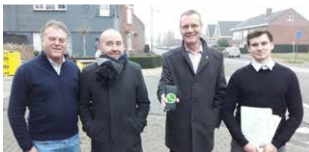
▲ Met WhatsAppgroepen voor buurtbewoners willen we de veiligheid nog verhogen.