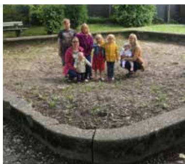
▲ Waar kunnen uw kinderen spelen? De N-VA heeft een antwoord klaar.

Maar het werk is nog niet gedaan! Zo blijft N-VA Wielsbeke onder meer streven naar: