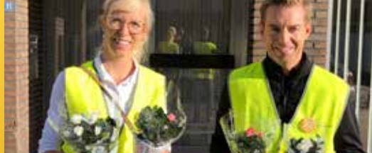
N-VA Wielsbeke in beeld (p. 2)