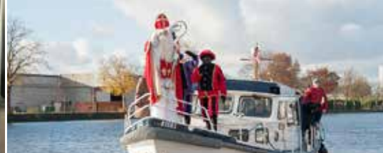
Hij komt ... op 23 november! (p. 3)