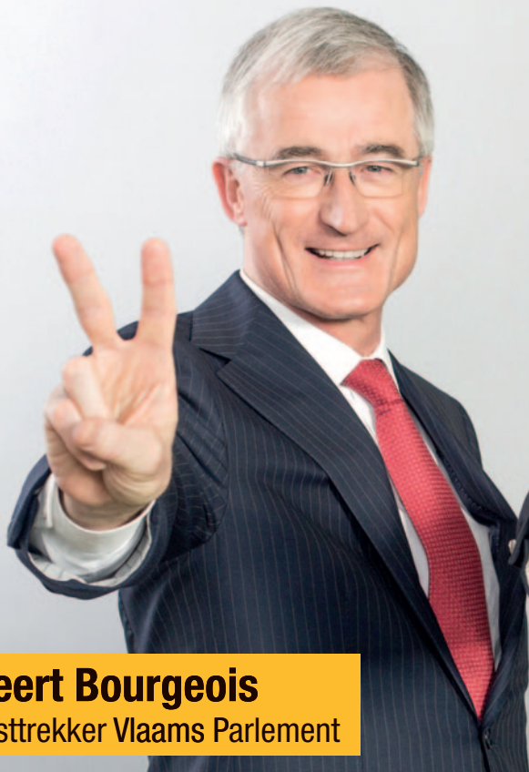
Geert Bourgeois Lijsttrekker Vlaams Parlement