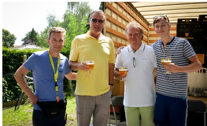
▲ Het N-VA-bestuur ontspant nog even met een Vlaamse Leeuw-bier om er nadien weer tegenaan te gaan.

N-VA Wielsbeke blijft ondertussen verder groeien, het nieuwe bestuur zit niet stil en zal zich verder inzetten voor de