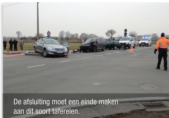
De afsluiting moet een einde maken aan dit soort taferelen.