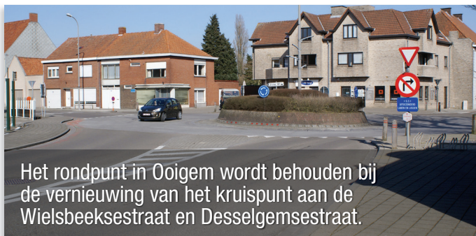
Het rondpunt in Ooigem wordt behouden bij de vernieuwing van het kruispunt aan de Wielsbeeksestraat en Desselgemsestraat.

Door deze rioleringswerken zullen regenwater en vuil water zoveel mogelijk gescheiden worden. Per afkoppeling voorziet de gemeente maximaal 750 euro subsidies. Een afkoppelingsdeskundige zal de inwoners inwoners begeleiden bij deze noodzakelijke werken.