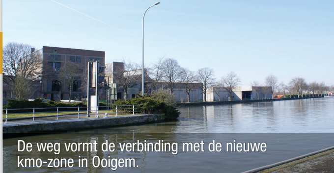
De weg vormt de verbinding met de nieuwe kmo-zone in Ooigem.

De geplande weg zal een verbinding vormen met de industrie- en kmo-zone, die in volle ontwikkeling is. De dorpskern van Ooigem wordt daardoor ontlast. De nieuwe weg loopt langs de bedrijven Benelux, Crop's en Vanden Avenne lopen om dan via de Zwaantjesstraat uit te monden op een nieuwe rotonde in de Fabiolalaan.