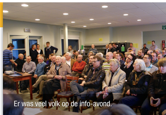
Er was veel volk op de info-avond.

Op de info-avond bleek dat handelaars omzetverlies vrezen. De kinderopvang sprak zelfs van een failliet. Sommige aanwezigen zagen liever een gedeeltelijke afsluiting of flitspalen die snelheidsduivels moeten ontraden. Maar er zijn ook voorstanders van de afsluiting, omdat het aantal ongevallen zal dalen en de woningen langs de baan in waarde zullen stijgen.